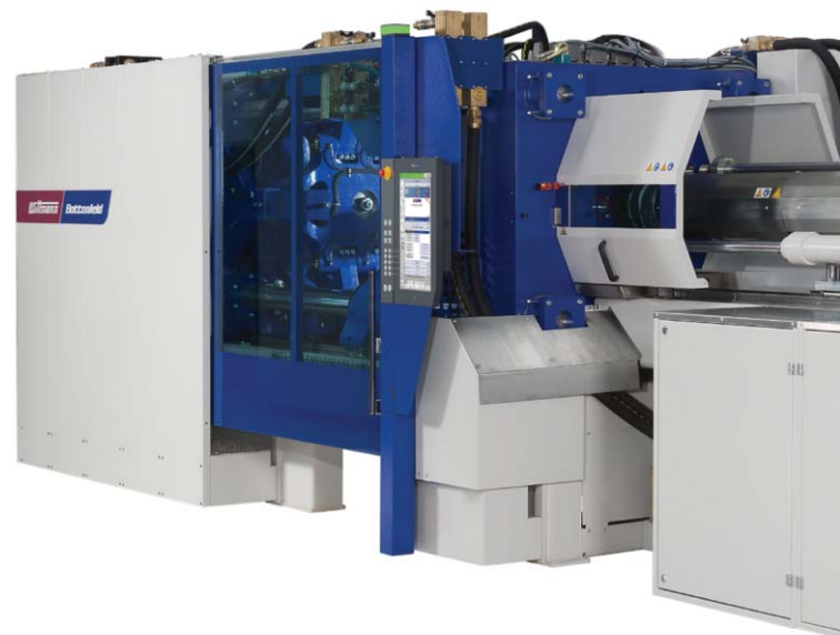
EcoPower Xpress – az új, rendkívül dinamikus, teljesen elektromos sorozat.

Az EcoPower Xpress összes főbb mozgását vízűtési segéd-motorok hajtják. Standard változatban hidraulikus kiegészítő